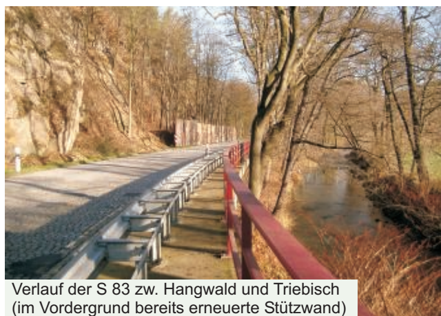
Verlauf der S 83 zw. Hangwald und Triebisch (im Vordergrund bereits erneuerte Stützwand)

Die Fortschreibung der Vorentwurfsunterlagen für die Planfeststellung ist für 2009 vorgesehen.