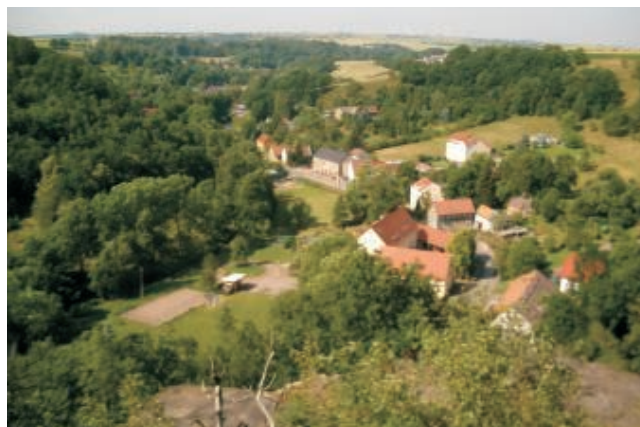
Blick von den Pechsteinklippen über das Triebischtal

Da das Triebischtal als FFH-Gebiet „Triebischtäler“ gemeldet wurde, war eine FFH-Verträglichkeitsprüfung erforderlich. In Abstimmung mit den Naturschutzbehörden wurde diese auf der Stufe der Vorprüfung (1. Stufe) durchgeführt. Im Rahmen dieses Fachbeitrags wurde eine vorgesehene Felssicherungsmaßnahme mit Fangnetzen bzw. -zäunen oberhalb der Straße in Abstimmung mit den Umweltbehörden optimiert (Verringerung der Netzfläche durch Verlängerung von Fangzäunen). Hinsichtlich der vorkommenden FFH-Lebensraumtypen erfolgte ein Abgleich mit der Lebensraum-